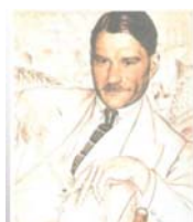
ЗАМЯТИН Евгений Иванович (1884 - 1937)

На этих вакцинах делают гигантские деньги. Для того же Билла Гейтса это огромный бизнес. Он вступил в альянс с этой фарма-мафией. При этом,