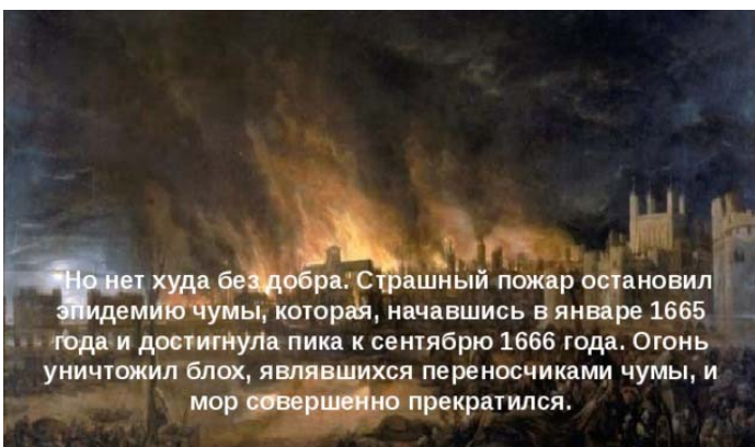
Но нет худа без добра. Страшный пожар остановил эпидемию чумы, которая, начавшись в январе 1665 года и достигла пика к сентябрю 1666 года. Огонь уничтожил блох, являвшихся переносчиками чумы, и мор совершенно прекратился.

Однако то, что в Англии капитализм стал развиваться после смерти примерно 6% населения (100 тыс. в Лондоне и