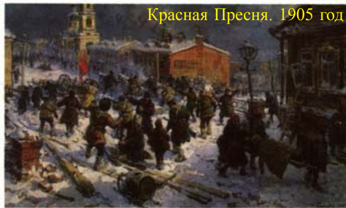
Красная Пресня. 1905 год

классового подхода к формированию широкого народного фронта. События революции подтвердили ленинское требование объединения сил на уровне не